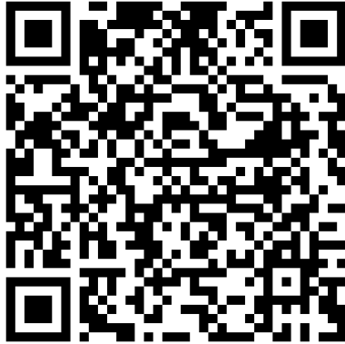
QR-Code Meldeplattform Asiatische Hornisse

Württemberg. Dies ist über die Meldeplattform auf der Homepage der Landesanstalt für Umwelt (LUBW), aber auch über die kostenlose „Meine Umwelt-App“ möglich: